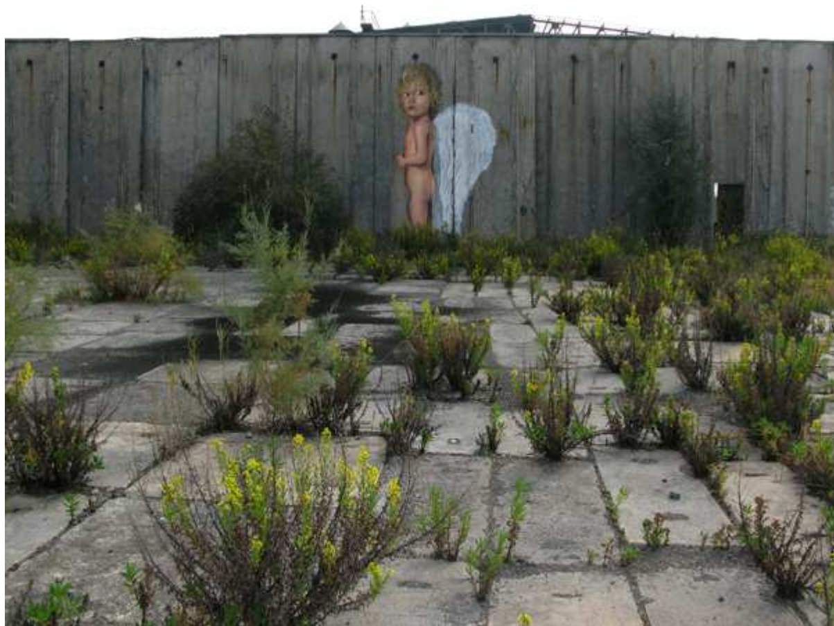
EX SAVA – INOLTRO ALL'UFFICIO ANGELI