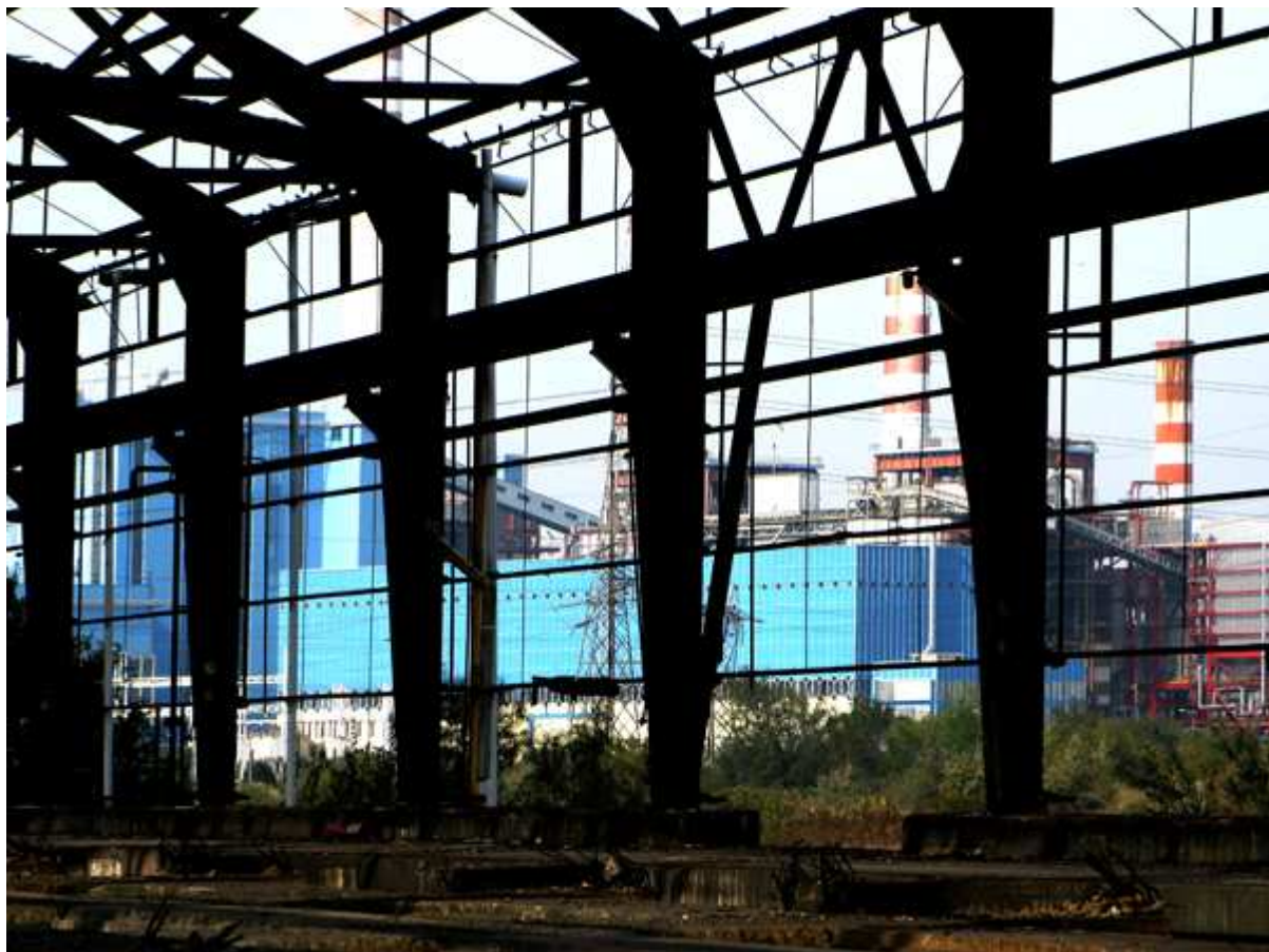
foto e testo Antonella Barina - Edizione dell'Autrice – n.42 (Collana Cose Agite)